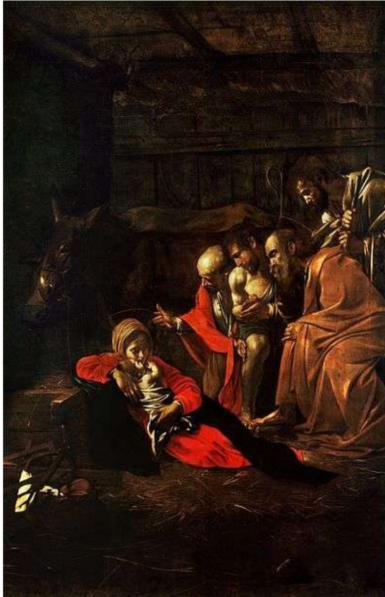
Pastores adorant Iesum infantem. Pinxit Michelangelo Merisi da Caravaggio circa annum 1609um. Quae pictura invenitur in Museo Regionali Messanio.