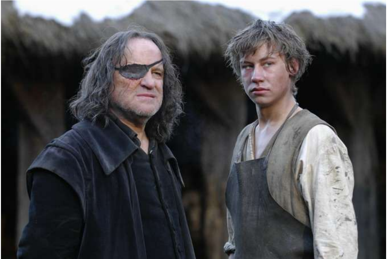
Magus Magister Molitor ( Christian Redl ) et Crabatus ( David Kross )