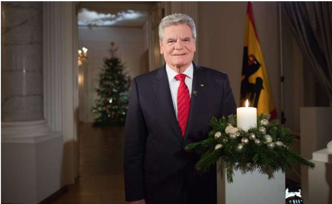
Gauck praeses foederalis : "Ita est, nos volumus societatem solidariam"

Ioachimus Gauck praeses Germaniae foederalis allocutione suâ nataliciâ cives adhortatur, ut adversus omnem mentium instabilitatem praestent animum fortem atque libertatem sermonis. Sequitur ipsa oratio praesidis foederalis, quae televisione emittetur vespere primae diei Natalis Domini.